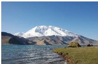
Zeltplatz am Fuße des Muztagh Ata