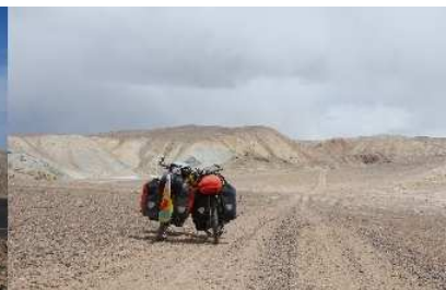
Einsamkeit im Pamir Tadschikistans