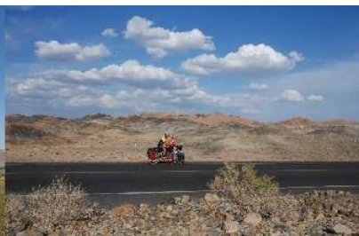
Unterwegs in der Wüste Gobi