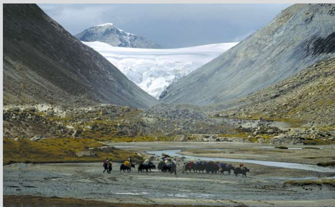
Ausrüstungstransport mit Yaks ins Basislager am Fuß des Nyanchen Thanghla Zentralgipfels. Transport of our equipment by Yaks, heading to the basecamp at the foot of the main peak of Nyanchen Thanghla.