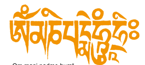
„Om mani padme hum“ – buddhistisches Mantra