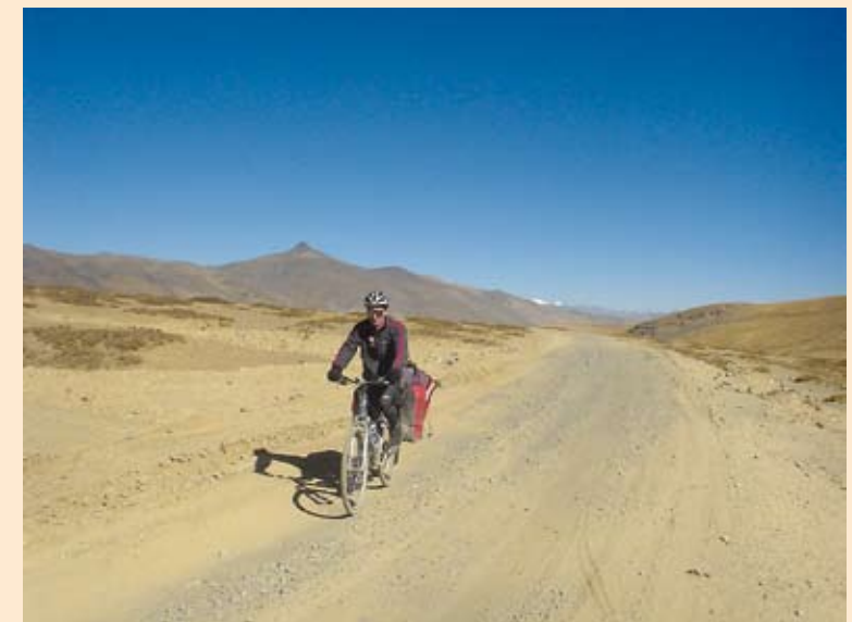
„Hauptstraße“ zum Peiku-Tso See. On the „main road“ to lake Peiku-Tso.