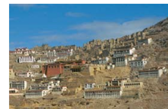
Aufnahme aus dem Jahr 1996: Teilweise restaurierte Klosteranlage von Ganden. Monastery of Ganden in the year of 1996.

Die buddhistische Idee hat überlebt. Das im Jahr 1959 fast dem Erdboden gleichgemachte Klosteranlage von Ganden – eines von 6000 zerstörten Klöstern – wurde von den Tibetern ähnlich wie andere Klosteranlagen aus eigener Kraft wieder aufgebaut.