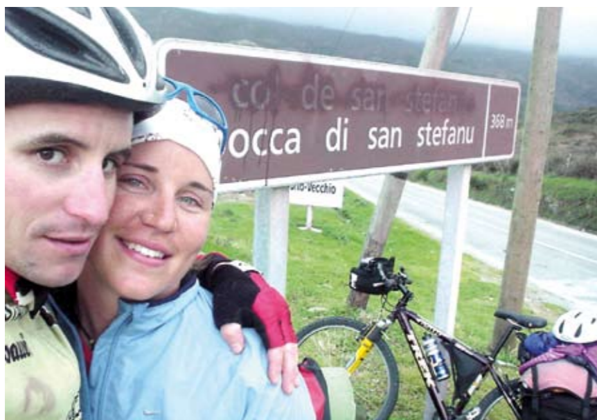
Mit dem Rad nach Korsika (2005).